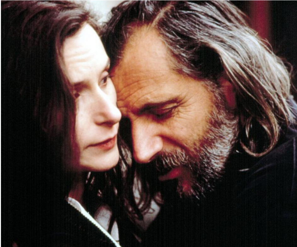
1994 BEFORE THE RAIN (Before the Rain) de Milcho Manchevski avec Rade Serbedzija