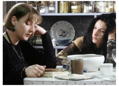
1993 NAKED (Naked) de Mike Leigh avec Lelsey Sharp