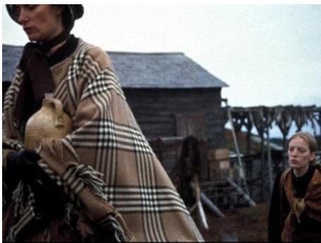
2000 LE POIDS DE L'EAU (The Weight of Water) de Kathryn Bigelow avec Sarah Polley