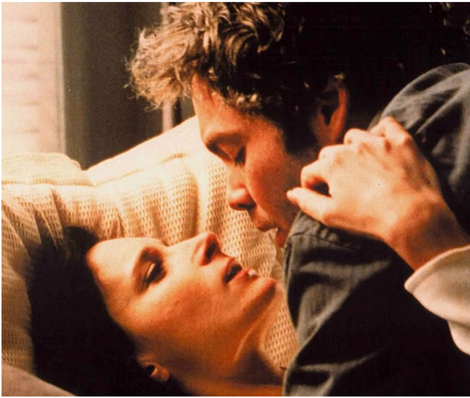
1998 CLAIRE DOLAN (Claire Dolan) de Lodge H. Kerrigan avec Vincent D'Onofrio