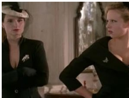
2000 CENDRILLON RHAPSODIE (Cinderella) de Beeban Kidron avec Lucy Punch