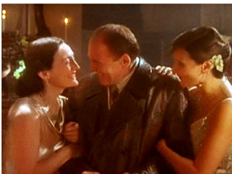
1997 SAINT-EX (Saint Ex) d'Anand Tucker avec Brid Brennan, Bruno Ganz