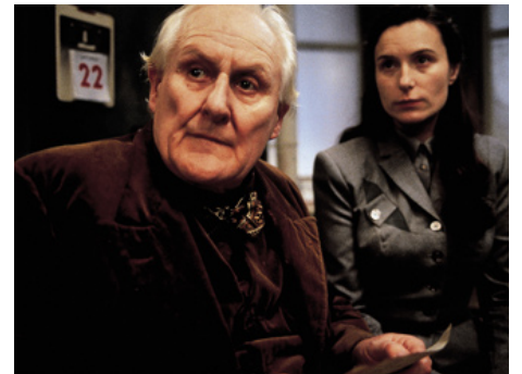
2000 HÔTEL SPLENDIDE (Hotel Splendide, the Last Resort) de Terence Gross avec Stephen Tompkinson