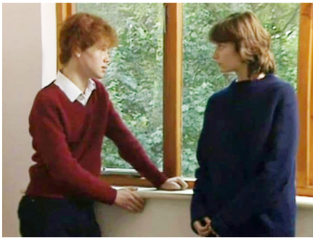
1982 BROOKSIDE (Brookside) de Chris Clough avec Nigel Crowley