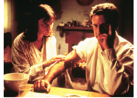
1998 THE LOST SON (The Lost Son) de Chris Menges avec Daniel Auteuil