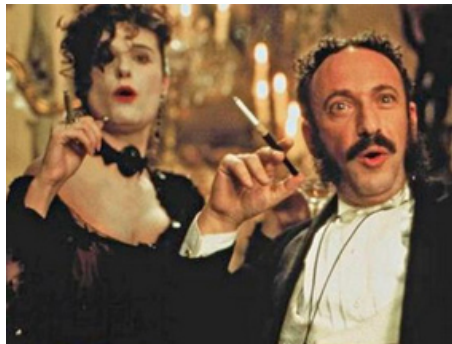
1999 TOPSY-TURVY (Topsy-Turvy) de Mike Leigh avec Allan Corduner