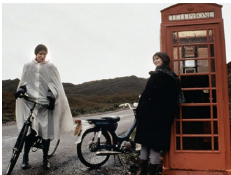
1996 BREAKING THE WAVES (Breaking the Waves) de Lars von Trier avec Emily Watson