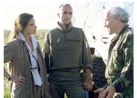
2001 NO MAN'S LAND (No Man's Land) de Danis Tanovic avec George Statidis, Simon Crolow