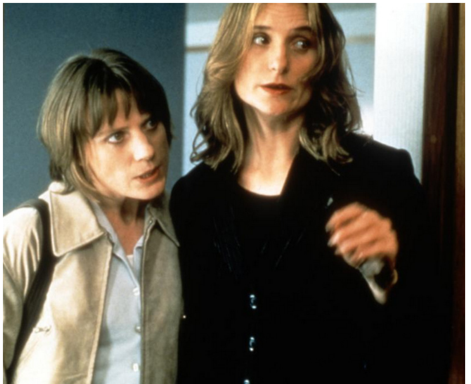
1997 DEUX FILLES D'AUJOURD'HUI (Career Girls) de Mike Leigh avec Linda Steedman